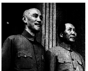
毛沢東(右)の謀略で国共合作した蒋介石

●日本共産党が目指している ソ連生まれの日本共産党は、ソ連崩壊後に目指している国はどこでしょうか? それが大軍拡を続け、南シナ海に軍事基地を建設している、共産党独裁の中国なのです(第23回党大会パンフ27頁)。