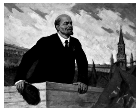
日本共産党の生みの親・レーニン

●日本共産党の生みの親 1917年のロシア革命を指導したレーニンは「金持ちを皆殺しにし、世界中の政府を暴力で転覆せよ!」とコミンテルン(世界共産党)を組織。その日本支部として誕生したのが日本共産党です。