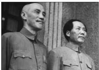
▲毛沢東の謀略で蒋介石を拉致し「国共合作」により国民党を操った

さてコミンテルン中国支部の毛沢東は「敵（日本）の敵（国民党）は味方」と国民党の蒋介石総統を拉致・脅迫し「国共合作」のスローガンの下で、共産党員が国民党組織に入