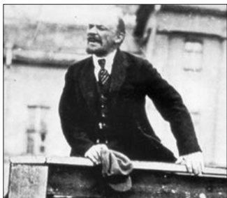
▲コミンテルンの父・レーニンは少数派から暴力革命で臨時政府を倒した

1917年のロシア革命を指導したレーニンは「全持ちを皆殺しにし、世界中の政府を暴力で転覆せよ」と「コミンテルン（国際共産党）を組織。その「日本支部」として誕生したが、実は日本共産党です。ロシアでは、皇帝を追放した2月革命に行われた選挙では2割しか議席を獲得できなかった少数党（ボリシエビキ）のレーニンは、連立政権に入りながら政権を潰す工