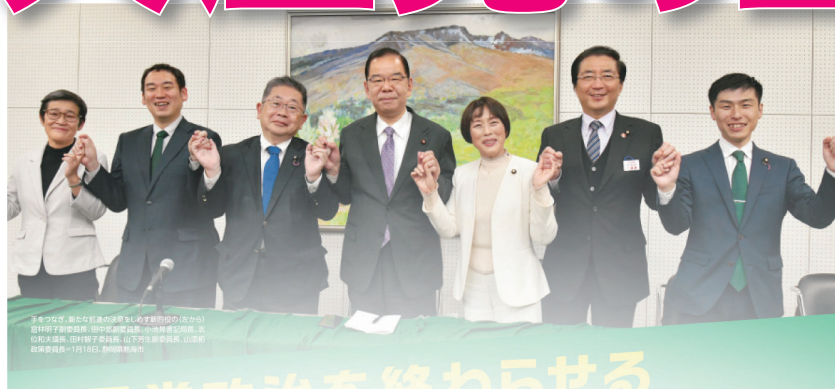
▶日本共産党新執行部の面々 (第29回党大会のボスターより)